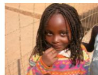
Repubblica Democratica del Congo (II)