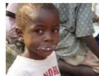
Repubblica Democratica del Congo (I)