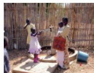
Sud Sudan – Emergenza Covid-19