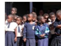
Repubblica Democratica del Congo – Pointe Noire