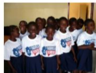
Repubblica Democratica del Congo – Lubumbashi