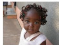
Repubblica Democratica del Congo – Katanga e Mokambo