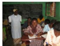
Repubblica Democratica del Congo – Kafubu (II)