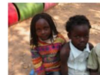
Repubblica Democratica del Congo – Kafubu (III)