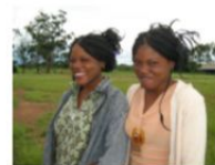
Repubblica Democratica del Congo – Katanga e Kafubu