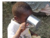
Repubblica Democratica del Congo