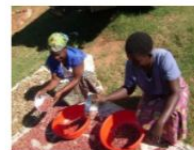
R.D. Del Congo