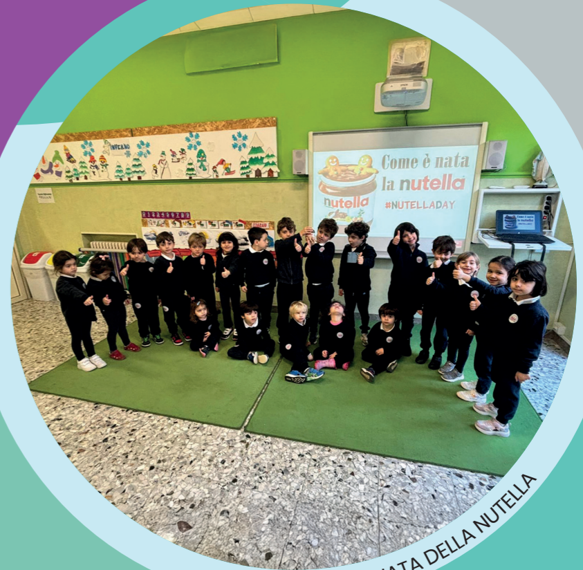
GIORNATA DELLA NUTELLA